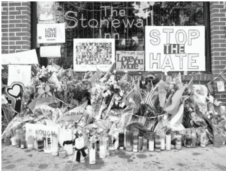
បង្គោលភ្លើងបំភ្លឺដែលត្រូវបានឧទ្ទិសដល់កុបកម្ម Stonewall ឆ្នាំ 1969 ដែលបានបង្ហាញ មោទនភាពរបស់ ញូវយ៉កនាចុងសតវត្សរ៍នៅឆ្នាំ 2016។ Stonewall Inn គឺជាបារស្រលាញ់ភេទដូចគ្នា នៅលើផ្លូវ Chris- topher នៅភូមិ Greenwich របស់ Manhat- tan មុនពេលការឆ្លុះបញ្ចាំងរបស់ប៊ូលីវនៅឆ្នាំ 1969។

អត្ថប្រយោជន៍ដែលជាភេទទី៣ ហើយរស់នៅក្នុងទីក្រុងឡុងប៊ិច ត្រូវបានបង្ហាញអារម្ម ណ៍ពិតដោយការកើនឡើងនៃការជួលផ្ទះ ដែលជាមិត្ត ហេតុនៃសង្កាត់ភេទទី៣ច្រើនមួយ។ យោងតាមគេហទំព័រអិ ចលនទ្រព្យបញ្ជីផ្ទះល្វែង បានកត់សម្គាល់ឃើញថាបច្ចុប បន្ននេះ ទីក្រុងបានកើនឡើង 4,8 ភាគរយនៃការជួលផ្ទះ ក្នុងឆ្នាំកន្លងមកដោយឈរនៅលំដាប់លេខ15 នៅទូទាំង ប្រទេសដោយសារតែការកើនឡើងនៃការជួលផ្ទះខ្ពស់បំផុត