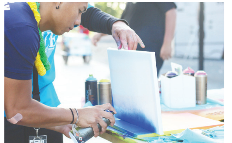
កុមារជាច្រើនបានចូលរួមជាមួយមនុស្សពេញវ័យដែលកំពុងប្រមូលផ្តុំជំនួយមនុស្សធម៌នៅឧទ្យាន Harvey Milk Promenade នៅថ្ងៃទី 3 ខែតុលាឆ្នាំ 2017 ។

ផ្ដើមពីអន្តរាគមន៍បាតុកម្មរបស់យុវវ័យ ទីក្រុងឡុងប៊ិចគឺមិនគ្រាន់តែជាគោលដៅទេសចរណ៍នោះទេ។ នេះគឺជាអត្ថបទរូបភាពដែលចងក្រងដោយអ្នកយកព័ត៌មានជាច្រើនរូបរបស់យុវវ័យ VoiceWaves ។