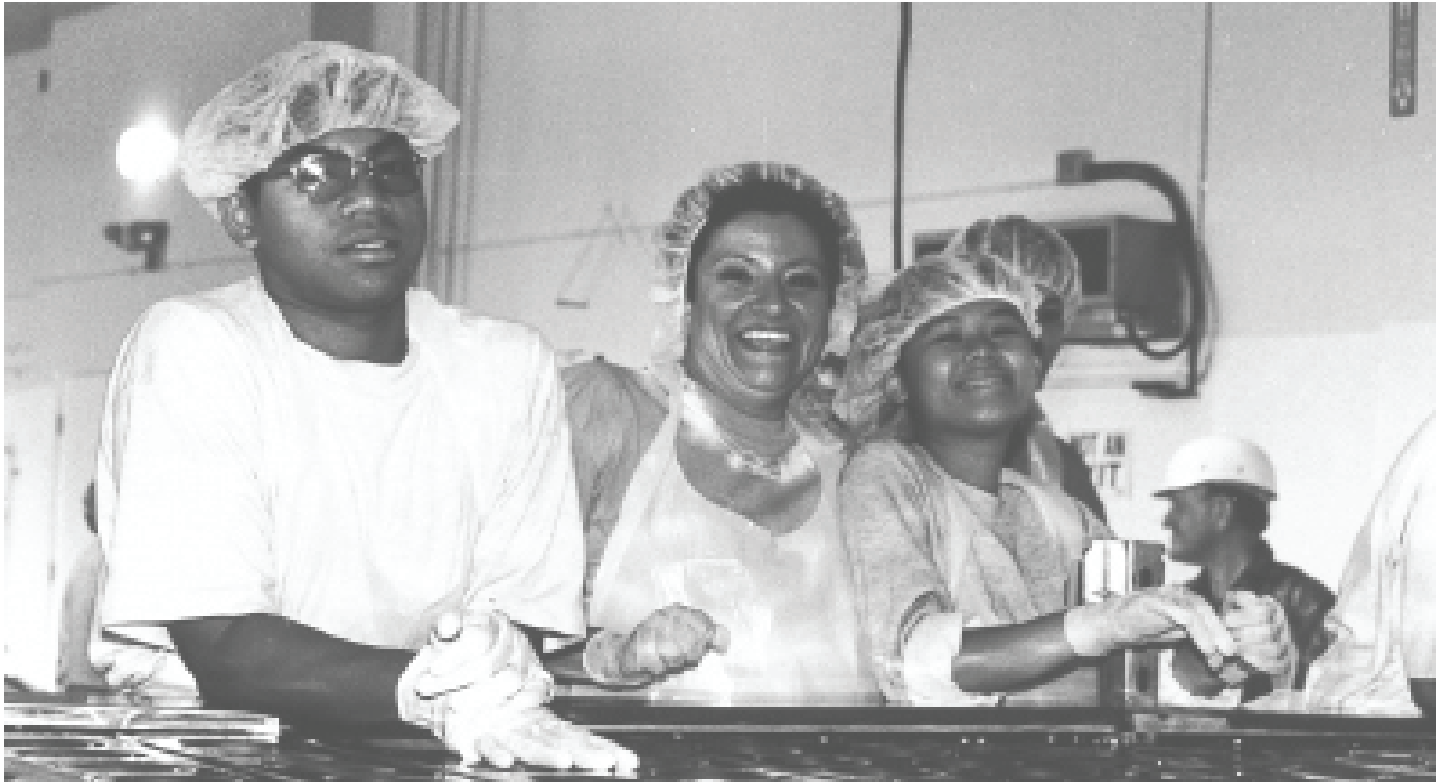
យុវជនមកពីសហគមន៍កម្ពុជាបានចូលរួមក្នុងកម្មវិធីការប្រកបក្នុងកំប៉ុងនៅទីក្រុងឡុងប៊ិចក្នុងឆ្នាំ 1994 ។

ខណៈពេលដែលដំណោះស្រាយជាទូទៅសម្រាប់ការជួលផ្ទះល្វែងទីក្រុងឡុងប៊ិចដែលមិនមានលទ្ធភាពគ្រប់