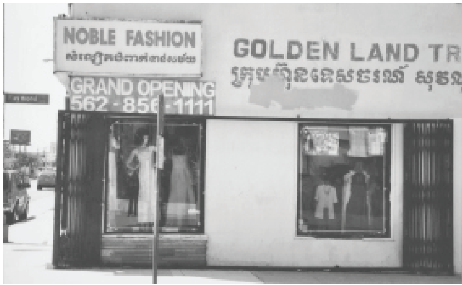
គោដីនីយដ្ឋានតូចតួចពេញប៉ោស៊ីហ្វិកនិងហាងលក់នំប៉័ង កំពូល និងហាងលក់សំលៀកបំពាក់ Noble Fashion នៅ Little Phnom Penh ខាងលើ នៅទីក្រុងឡងប៊ិច។