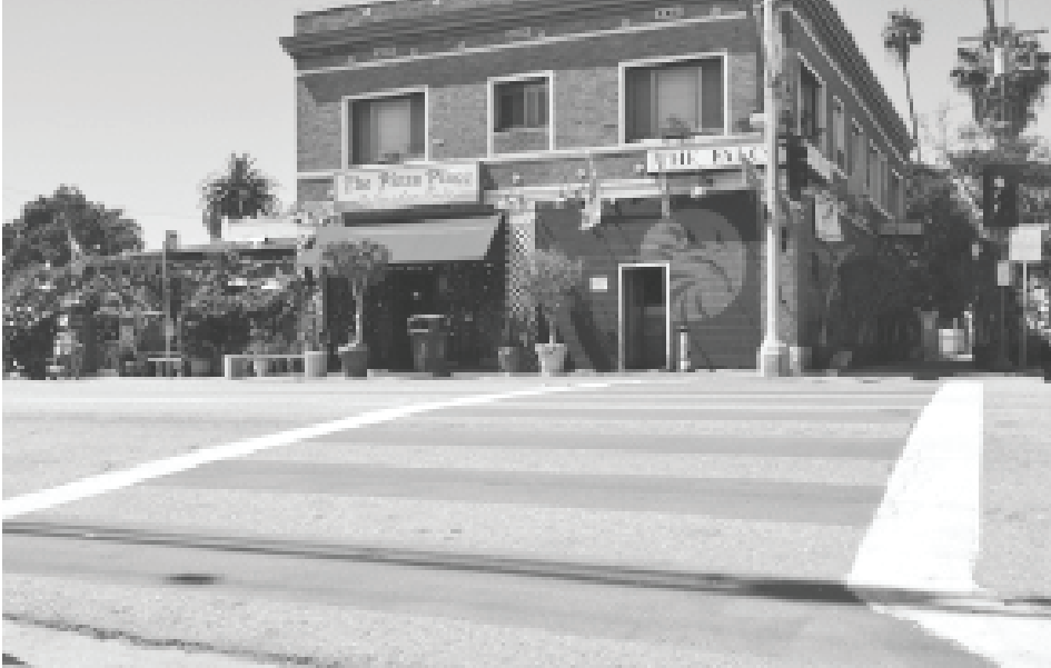
តាមដងផ្លូវត្រូវបានគ្របដណ្តប់នៅក្នុងឥន្ទន្ទនៃទីក្រុងឡុងប៊ិច។

សព្វថ្ងៃនេះ Fox កំពុងប្រឆាំងនឹងការទាមទាររបស់ប្រជាពលរដ្ឋចំពោះការជួលការិយាល័យនិងមូលហេតុ បណ្តេញចេញសម្រាប់សុវត្ថិភាពរបស់ប្រជាពលរដ្ឋ។ គាត់ក៏កត់សម្គាល់ពីរបៀបដែលទីក្រុងដូចជា Santa