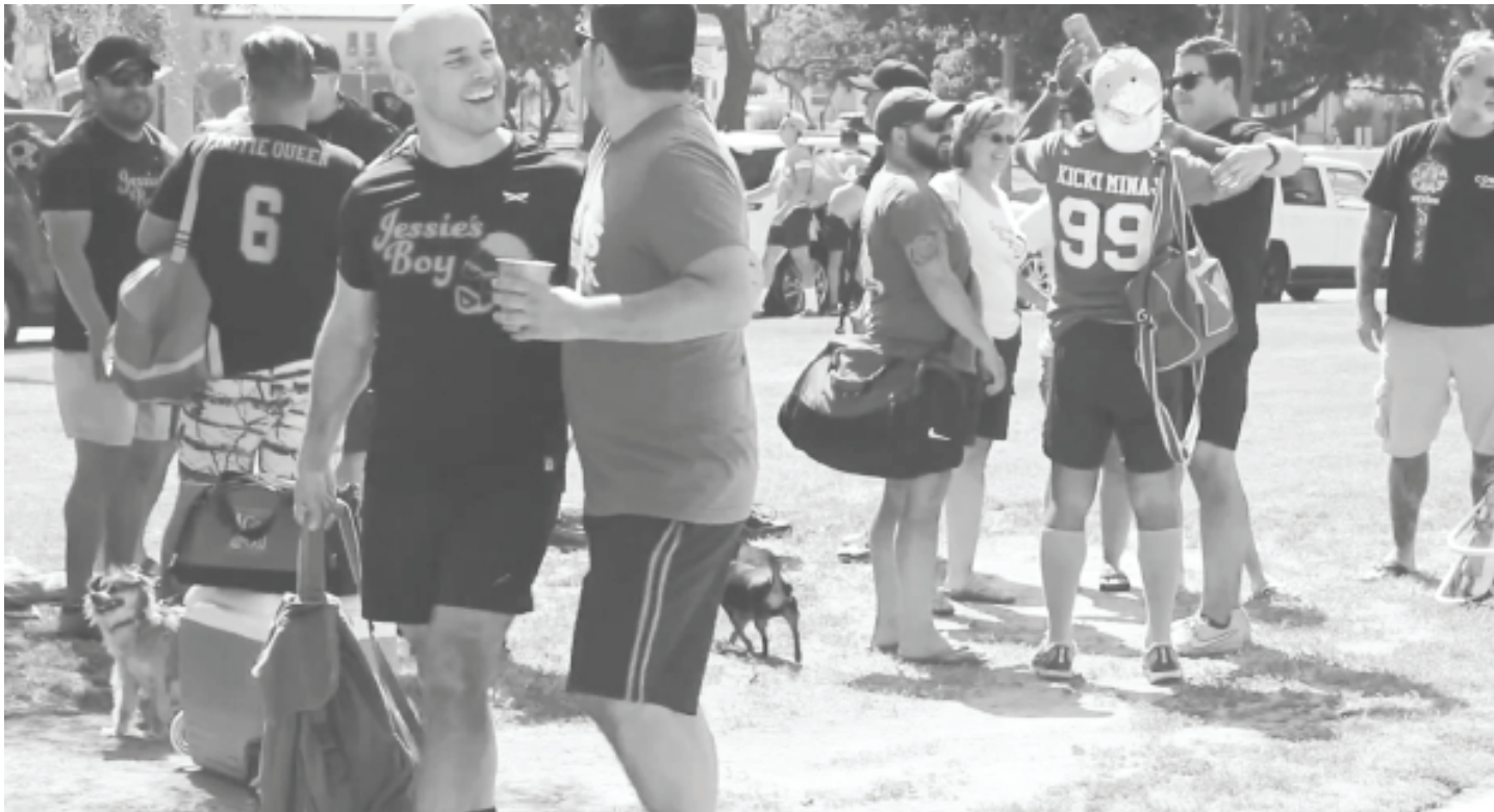
ខាងលើ: កីឡាករបាល់ទាត់លាយឡំគ្នាបន្ទាប់ពីប្រកួតនៅនិទាឃរដូវឆ្នាំ 2017 ។ ខាងក្រោម: កីឡាករទី 11 ព្យាយាមកំណត់អត្តសញ្ញាណគ្នាប្រជែងរបស់គាត់ដែលកំពុងរត់ទៅរកបាល់។ ខាងក្រោមនេះ: Varsity Gay League មានសម្ព័ន្ធបាល់ទាត់ LGBT Kickball តែមួយគត់នៅក្នុងរដ្ឋ California ។

“នេះគឺជាល្បែងដែលសិស្សថ្នាក់ទី៥ជាធម្មតាតែងតែលេង ប៉ុន្តែយើងៗមនុស្សក៏បានដាក់មកចាប់អារម្មណ៍លើមិត្តភាព។ ”