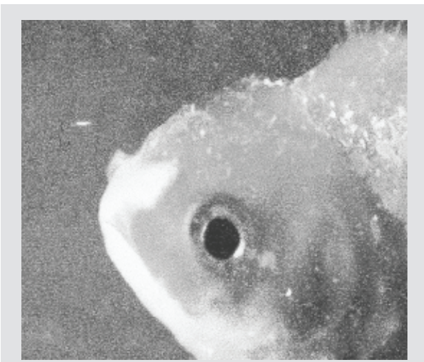
Vince Staples “Big Fish Theory” ARTium • Blacksmith • Def Jam

“Big Fish Theory” គឺជាឧបសគ្គដ៏ធំមួយសម្រាប់ Staples ដើម្បីយកវាទៅតែមានភាពជិតស្និទ្ធជាមួយអាកប្បកិរិយារបស់ការរ៉បរបស់គាត់ដែលជំរុញឱ្យមាននិទានរឿងរបស់គាត់ដោយប្រើសម្លេងគួរអោយភ័យខ្លាច។ សាររបស់វាប៉ុន្តែមទៀតជំរុញឱ្យ Staples ក្លាយជារឿងជោគជ័យមួយសម្រាប់ការប្រឆាំងនឹងរបៀបរស់រានមានជីវិតដែលត្រូវបានផ្សព្វផ្សាយដោយប្រព័ន្ធផ្សព្វផ្សាយ។