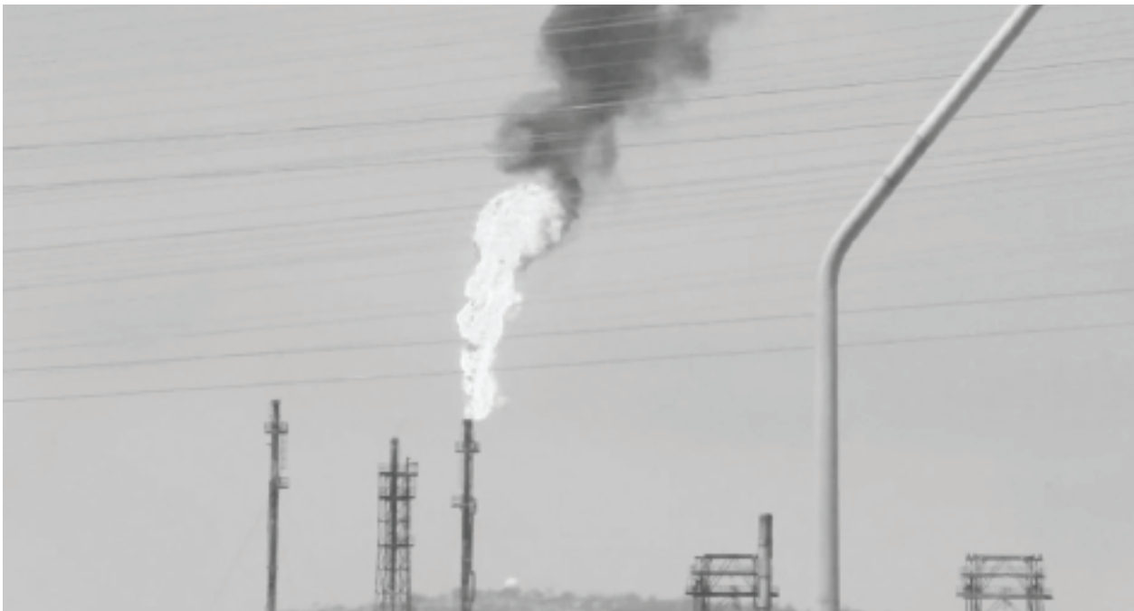
ការផ្ទុះដ៏ធំមួយបានផ្ទុះឡើងនៅពេលចក្រស្នូលប្រេងក្បែរនោះដែលនៅជិត Andeavor នៅWilmington ដែលជាសហគមន៍មួយនៅទីក្រុង Los Angeles នៅថ្ងៃទី 28 ខែមិថុនាឆ្នាំ 2017។

នោះរួមបញ្ចូលការបង្កើតឧបករណ៍សម្ពាធថ្មីជាច្រើនសម្រាប់បញ្ហា ដែលអាចបណ្តាលឱ្យមានការបំភាយឧស្ម័នដ៏ធំក្នុងអំឡុងពេលមាន អាសន្ន - ហើយមានប្រ