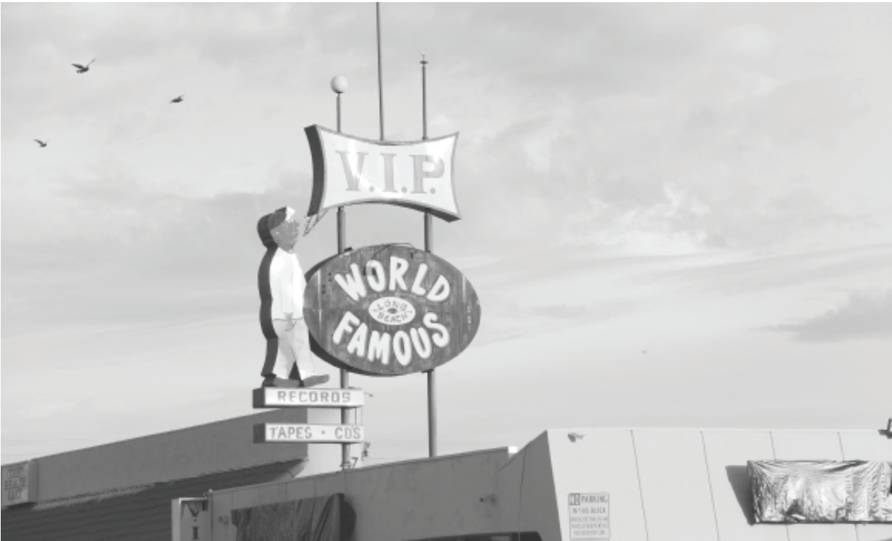
ក្រុមប្រឹក្សាក្រុងឡងប៊ិចបានបោះឆ្នោតដាច់កិច្ចសន្យាដើម្បីកំណត់ឈ្មោះហាងលក់សម្រាប់V.I.P. ដ៏ល្បីល្បាញនៅក្នុងពិភពលោក ជាប្រវត្តិសាស្ត្រនៅថ្ងៃទី 19 ខែធ្នូឆ្នាំ 2017 ។ សញ្ញានេះត្រូវបានគេយកចុះក្រោមដើម្បីស្តារនិងផ្លាស់ទីលំនៅវិញ។

Anderson បាននិយាយថា “ខ្ញុំបានបើកស្នូលនៃយោងយោងសារវិញពីហិង្សា។ លោក Steven Richardson អាយុ 42 ឆ្នាំបានដឹងពីក្តីនៅក្នុង “តំបន់ខាងកើត” របស់ទីក្រុងឡងប៊ិចដែលគាត់បានឃើញតម្រូវការទាំងអស់សម្រាប់ស្នូលនោះ។ គាត់បាននិយាយថា “ខ្ញុំបានរៀនរបៀបរត់គេចនៅពេល